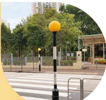
現時斑馬線黃波燈及黑白柱